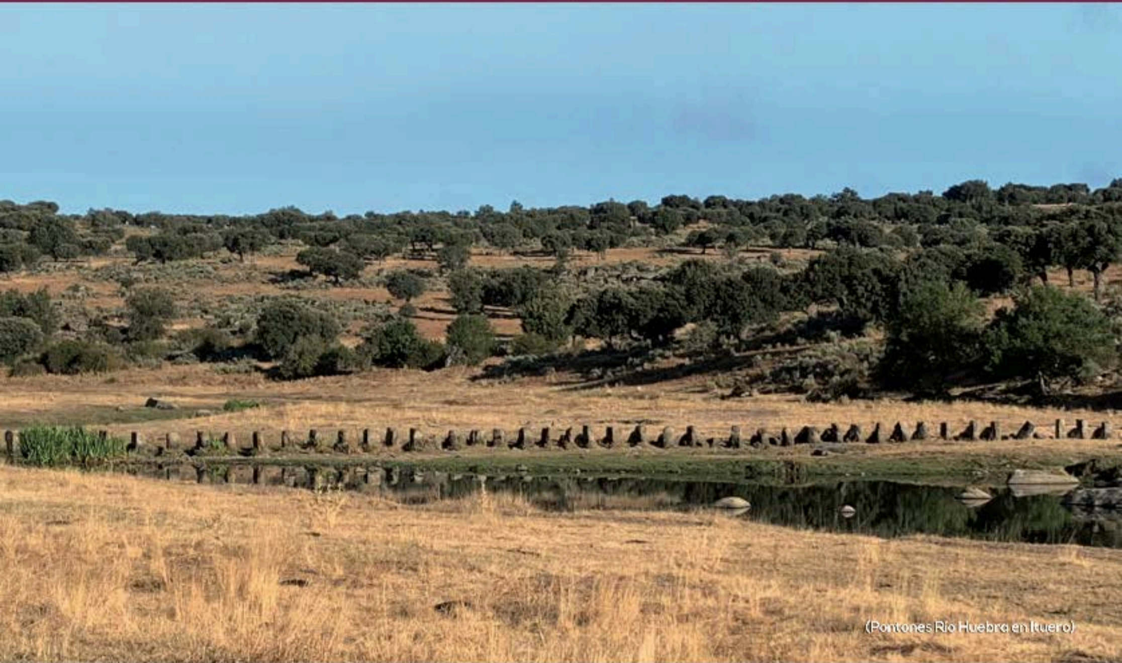
(Pontones Río Huebra en Ituerro)

"Con la colaboración de todos, todo es posible y más fácil."