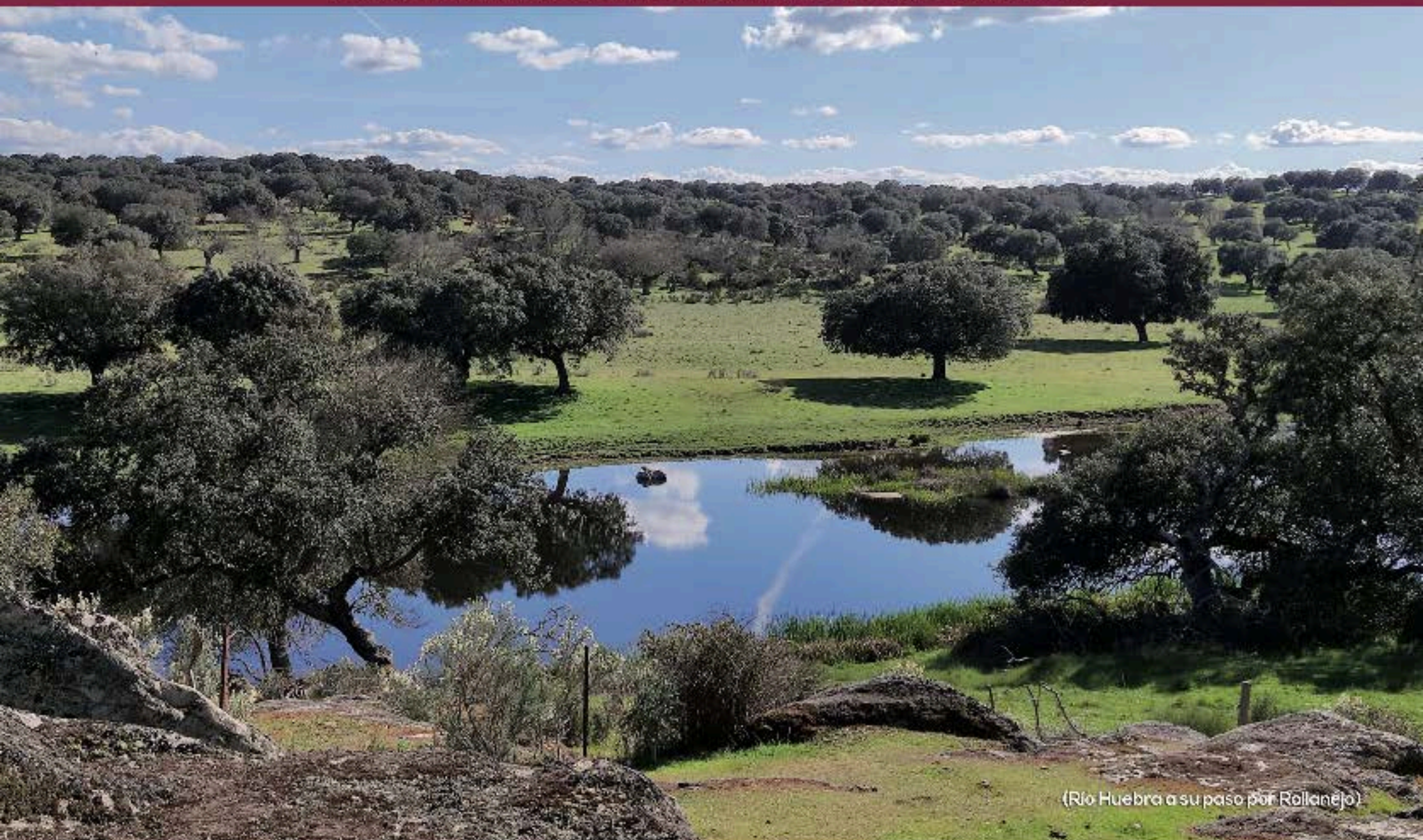
(Río Huebra a su paso por Rollanejo)

"Con la colaboración de todos, todo es posible y más fácil."