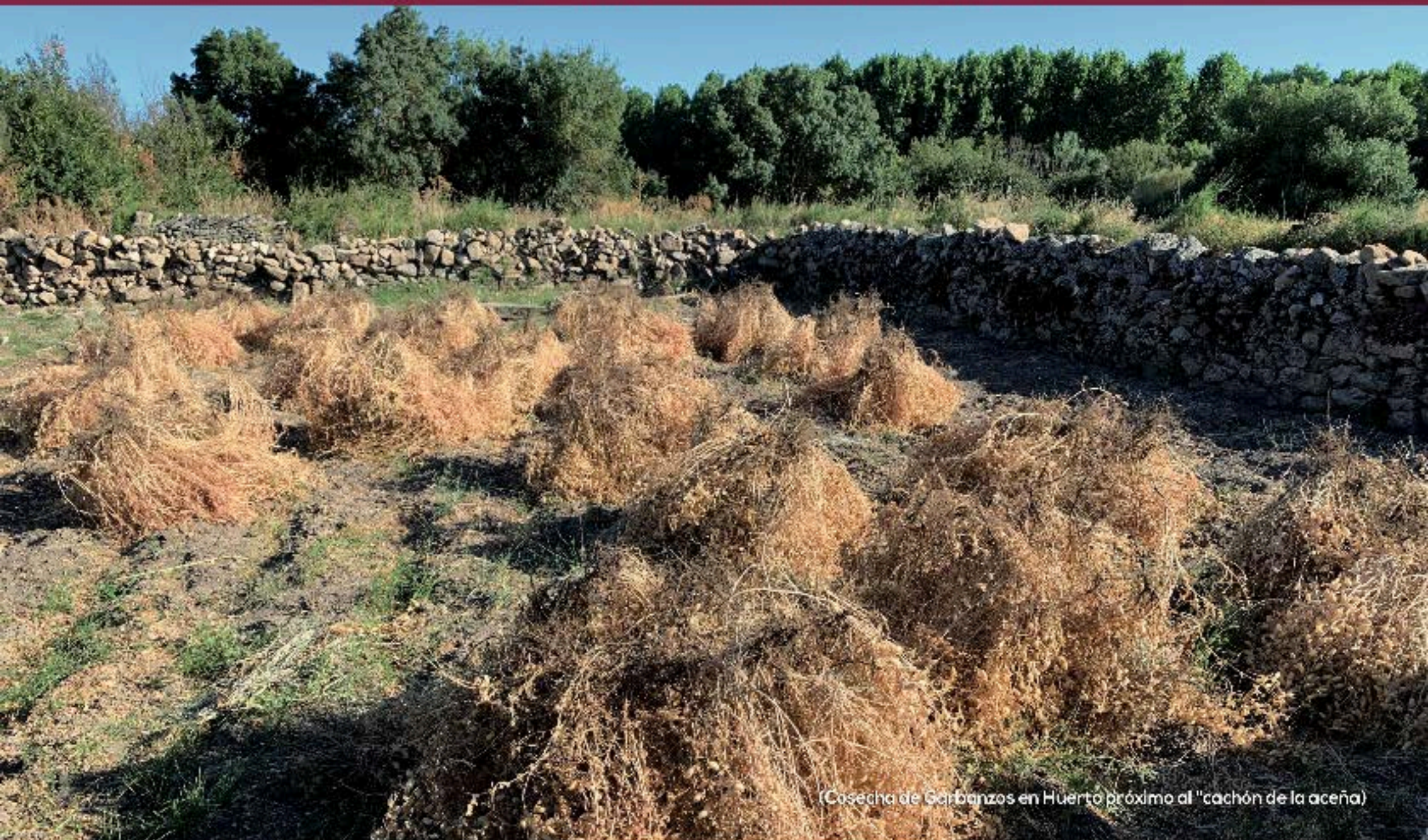
(Cosecha de Garbanzos en Huerto próximo al "cachón de la aceña")

"Con la colaboración de todos, todo es posible y más fácil."