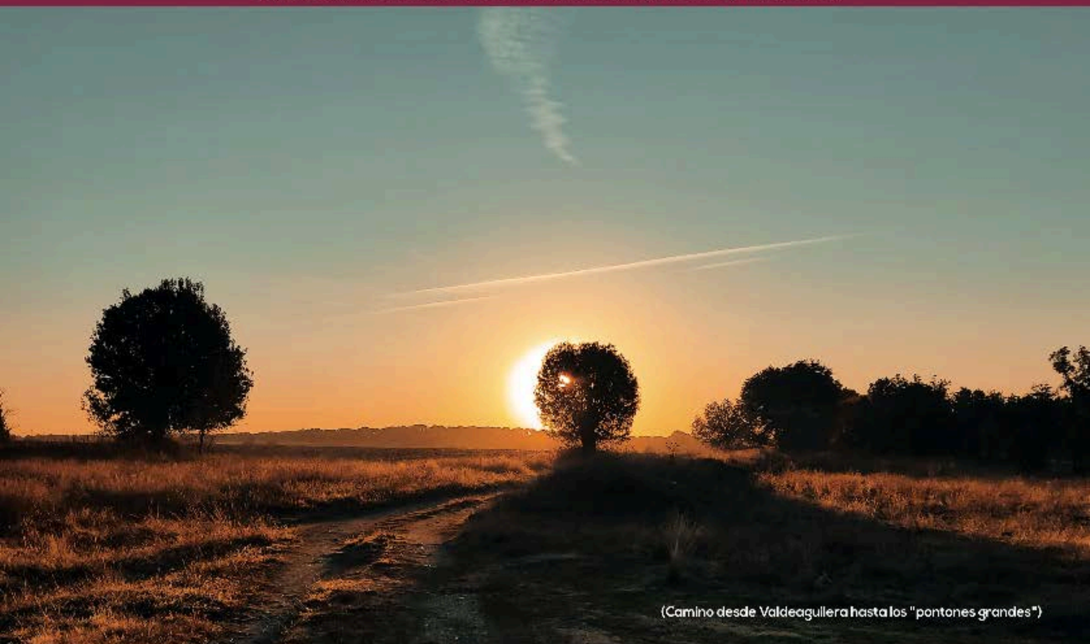
(Camino desde Valdeagullera hasta los "pontones grandes")

"Con la colaboración de todos, todo es posible y más fácil."